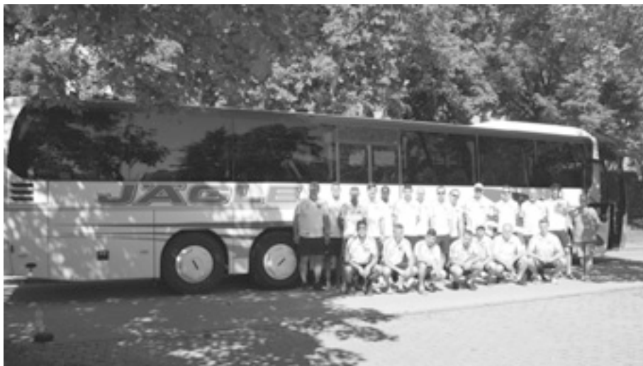
Die Firma Jägle GmbH hat sich bereit erklärt, die Auswärtsfahrten der 1. Mannschaft großzügig zu unterstützen. Dafür ein herzliches Dankeschön!