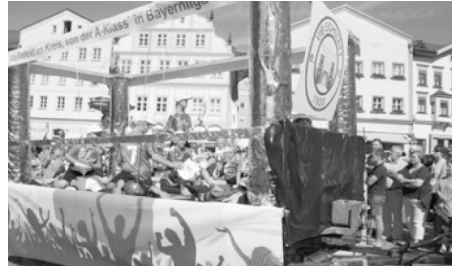
Beim Jubiläumsumzug des Eichstätter Volksfest nahm der VfB mit einem eigenen Wagen teil. Der Fußballnachwuchs hatte beim Autoscooter richtig Spaß.